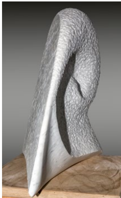
Ulrike Breitmann: „Metamorphose + Das große R“ - Marmor 2009+03